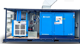
PS - Sonder-Anlagenbau

Sehr geehrter Geschäftsfreund und Kunde, mit Direkt-Durchwahl geht's schneller . . .