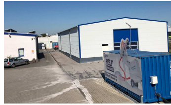
neue Halle-II „Sonder-Anlagenbau“

www.pressluft-schaefer.de info@pressluft-schaefer.de